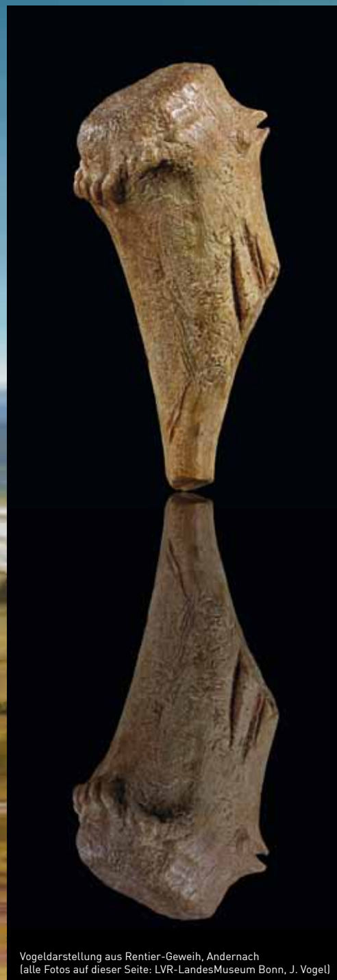
Vogeldarstellung aus Rentier-Geweih, Andernach

Der Begleitband erscheint im Nünnerich-Asmus Verlag, Mainz. Ca. 348 Seiten, mit ca. 240 farbigen Abbildungen, gebunden. Sonderpreis im Museumsshop 19,90 €, überall im Buchhandel für 29,90 € erhältlich (ISBN: 978-3-943904-80-2)