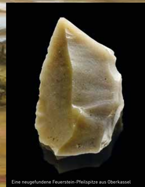
Eine neugefundene Feuerstein-Pfeilspitze aus Oberkassel