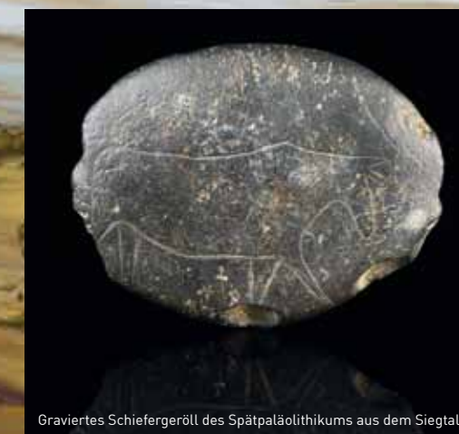
Graviertes Schiefergeröll des Spätpaläolithikums aus dem Siegtal