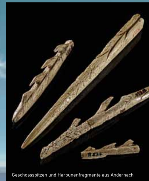
Geschosspitzen und Harpunenfragmente aus Andernach