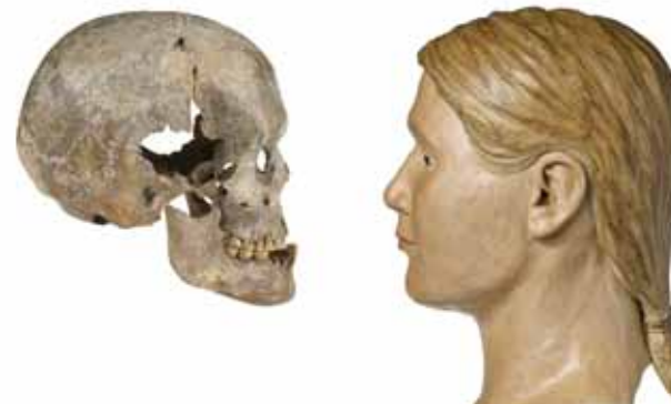
Vergleich Schädel und Gesichtsrekonstruktion der beiden Oberkasseler Menschen (Rekonstruktion C. Niess)

info@kulturinfo-rheinland.de , Tel 02234 9921-555. „Infopoint Museumspädagogik“ im Museumsfoyer unter 0228 2070-277 (Di-Fr 9-13Uhr)