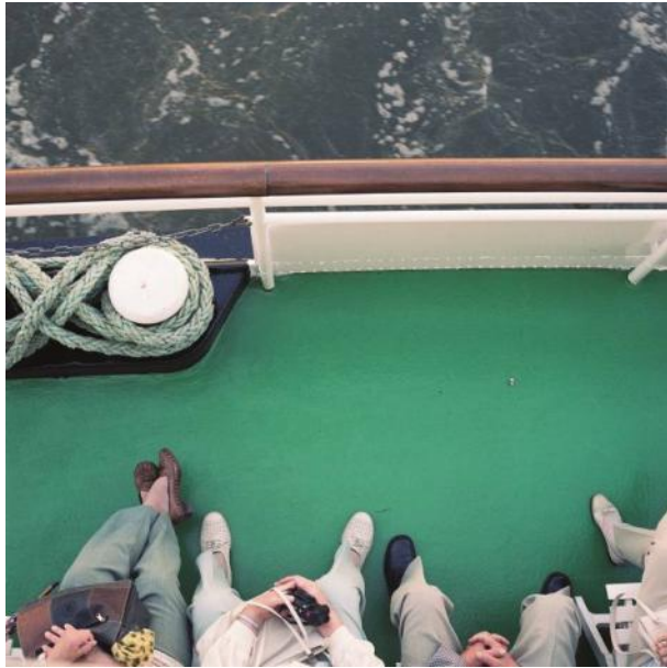
Valeska Achenbach & Isabela Pacini, ohne Titel, 2003.