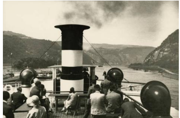
Hannes Maria Flach, Rhein, ca. 1931.