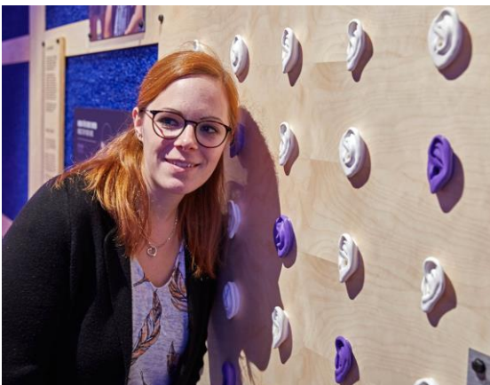
Der Prozess des Hörens wird in der Mitmachstation „Wie wir Hören“ genauer erläutert.