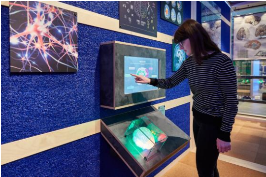
Die Mitmachstation „Musik in unserem Gehirn“ zeigt wie Musik uns anregt.