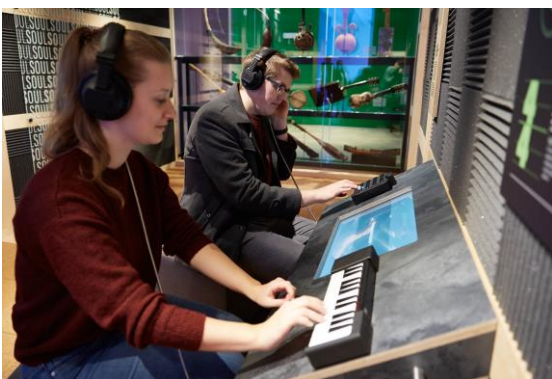
So unterschiedlich wie wir Menschen sind, so individuell ist auch Musik, die wir hören und die wir machen.