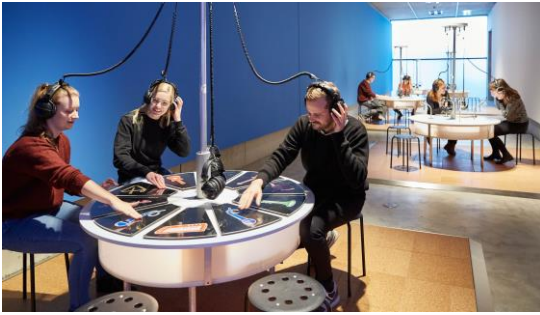
Spieltische des MobilesMusikMuseum, von Michael Bradke