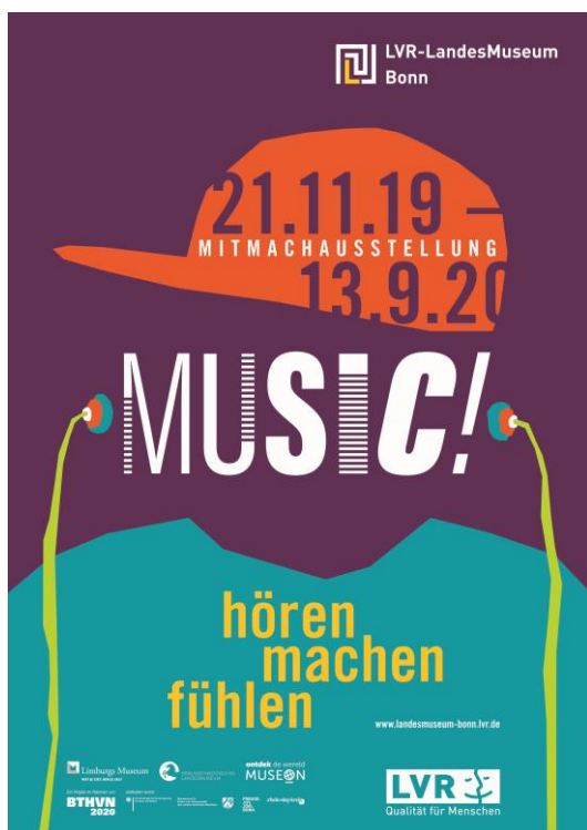
Plakat zur Ausstellung „Music!“ im LVR-LandesMuseum Bonn

Alle Fotos sind urheberrechtlich geschützt und nur zur Berichterstattung über die Ausstellung „MUSIC! hören – machen -fühlen“ freigegeben. Wir bitten um vollständige Nennung des Bildnachweises. Hoch aufgelöste Versionen der Fotos und weitere Auskünfte erhalten Sie von der Pressestelle.